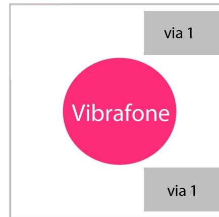
Espaço aproximado: 1,5x1,5m